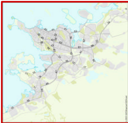
Umferðarspá fyrir höfuðborgarsvæðið 2024