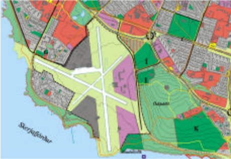
Aðalskipulag Reykjavíkur 1996-2016 - Vatnsmýri

Þann 17. mars 2001 fór fram almenn atkvæðagreiðsla meðal borgarbúa í Reykjavík um framtíðarnýtingu flugvallarsvæðisins í Vatnsmýri. Alls greiddu 30.219 atkvæði, eða 37,2% atkvæðisbærra manna í borginni. Af þeim vildu 14.913 að flugvöllurinn færi úr Vatnsmýrinni eftir árið 2016 en 14.520 vildu að flugvöllur yrði áfram staðsettur þar. Þessi niðurstaða er ekki bindandi fyrir borgarstjórn Reykjavíkur en aðalskipulagið tekur þó mið af henni þar sem gert er ráð fyrir að umfang flugvallarstarfsemi dragist saman í áföngum á skipulagstímabilinu en íbúðarbyggð og atvinnustarfsemi aukist að sama skapi.