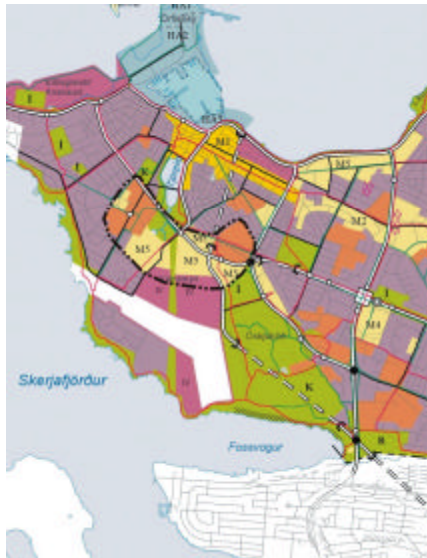
Ás rannsóknna og þekkingar

Landspítala-háskólasjúkrahúss við Hringbraut styrkir Vatnsmyrina enn frekar sem þróunarsvæði í þessu samhengi.