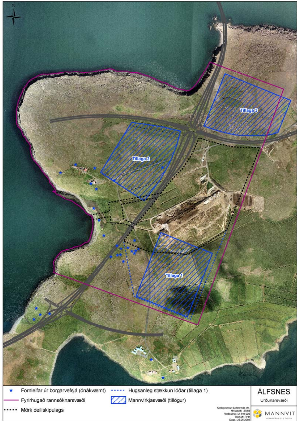
Mynd 1b. Mögulegar staðsetningar fyrir athafnasvæði Sorpu.