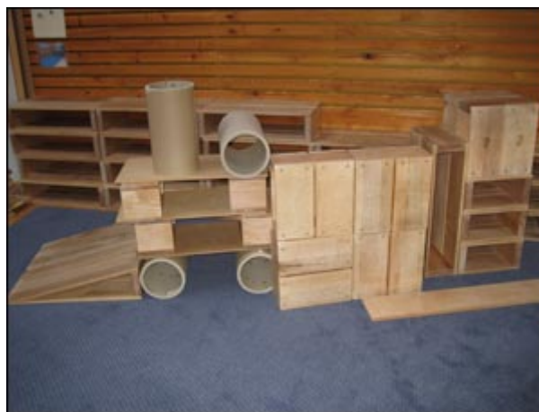
Lestin. Unnið af börnunum á Bakka eftir heimsókn á sýninguna Da Vinci í dag.

Á mynd 2. sést yfirlit yfir það samstarf sem leikskólarnir eiga í við listamenn eða listgreinakennara. Samkvæmt því eru það einungis 24 leikskólar sem svara því til að þeir séu í samstarfi við utanaðkomandi listamenn eða listgreinakennara. Þar kemur fram að flestir fá til sín utanaðkomandi aðila í danskennslu. Að lokum var spurt að því hvort leikskólinn væri í samstarfi við einhverja aðra en þá sem voru taldir upp á mynd 2. Dæmi um svör voru: íþróttakennari, leirkerasmiður, Myndlistarskólinn í Reykjavík, skákkennsla og grunnskólakennari sem kennir dans og hreyfingu. Það kom líka skýrt fram í svörum leikskólanna að mannauðurinn í leikskólanum var vel nýttur í listnám barnanna.