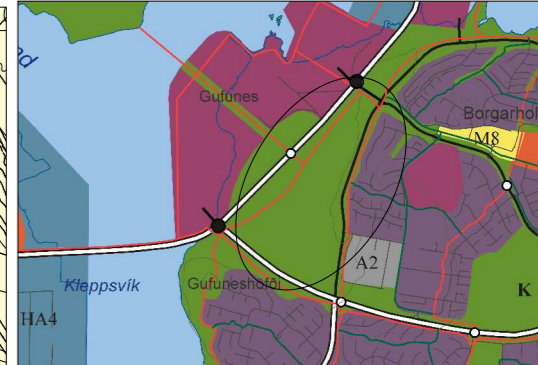
Hluti af aðalskipulagi Reykjavíkur 2001-2024.