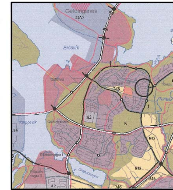
Yfirlitsmynd úr aðalskipulagi Reykjavíkur 2001-2024