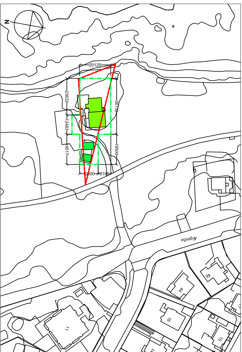
AFSTÖÐUMYND AF LÓÐARAFMÖRKUN EFTIR BREYTINGU MKV. 1:1000