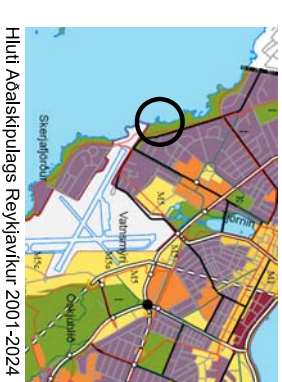
Hilutí Adalskipulags Reykjavíkur 2001-2024