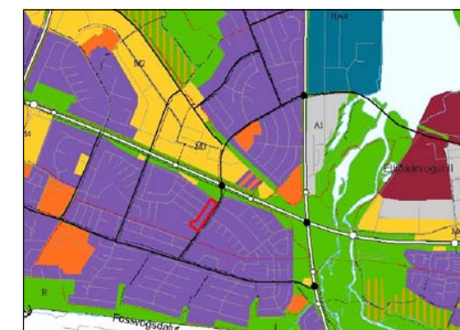
Aðalskipulag Reykjavíkur 2001-2024