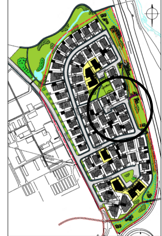
Hluti af Aðalskipulagi Reykjavíkur 2001-2024