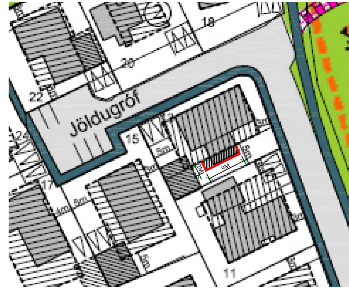
BREYTINGAR Á DEILISKIPULAGI 1:500