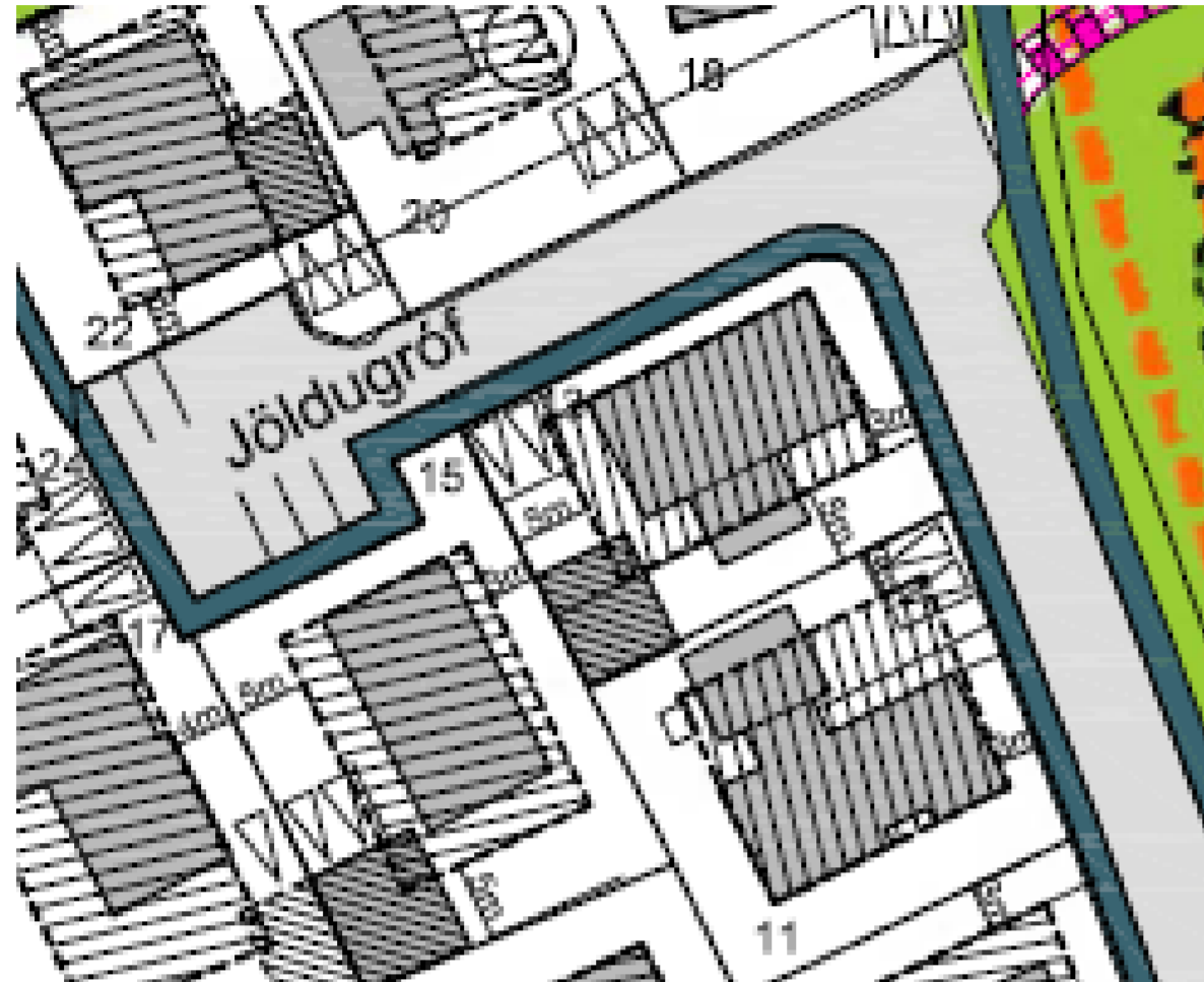
ÚRDRÁTTUR ÚR GILDANDI DEILISKIPULAGI eins og það var samþykkt í Skipulagsráði 28. september 2005