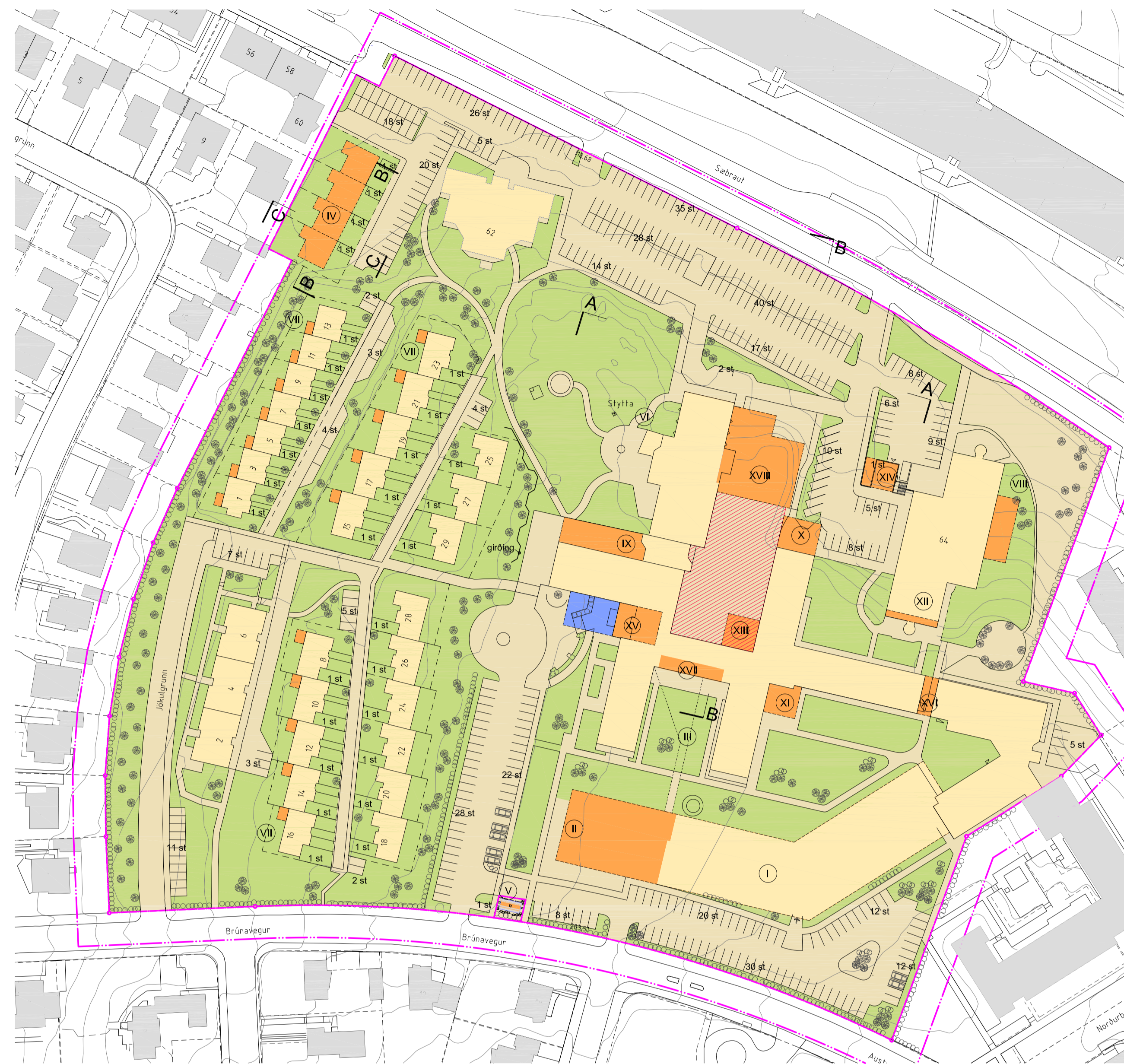
Tillaga að breyttu deiliskipulagi - mkv:1:1000