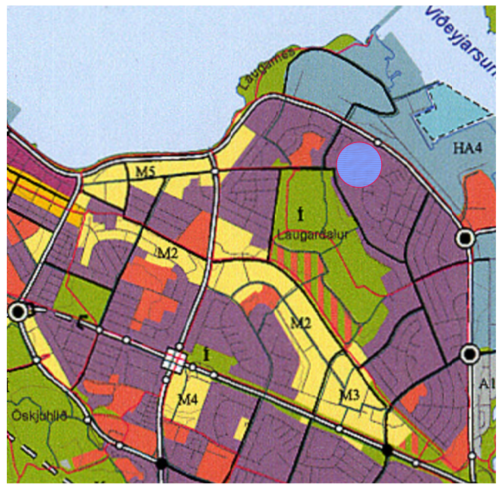
Aðalskipulag Reykjavíkur 2001- 2024