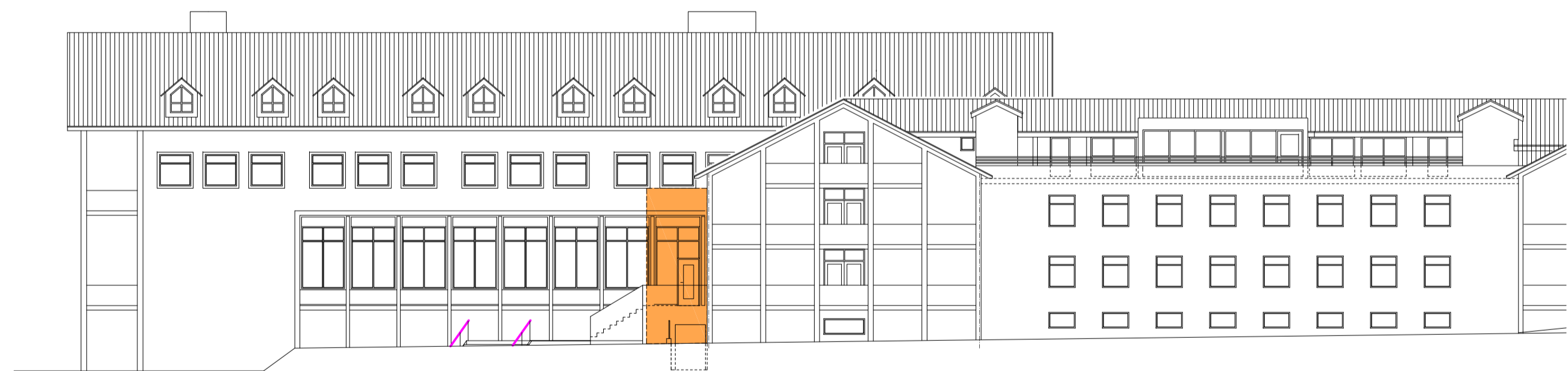
Snið fyrir breytingu - mkv:1:200