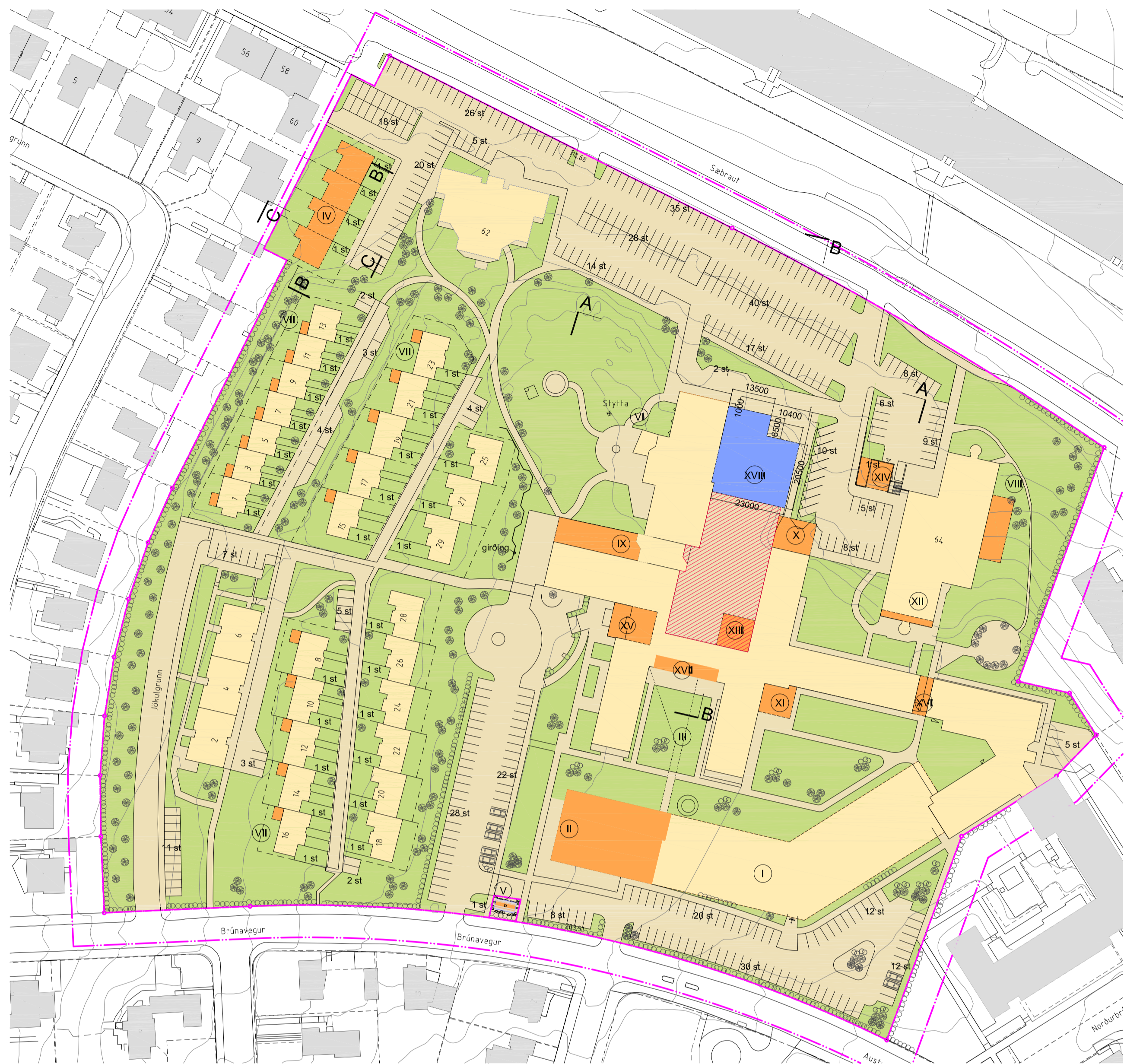
Deiliskipulag samþykkt í skipulagsráði 12.07.2006, auglýst í b-deild stjórnartíðinda 08.08.2006 - mkv:1:1000