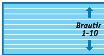
50 metra laug