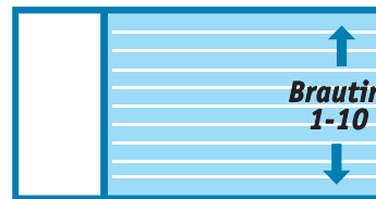
40 metra laug og 10 metra laug með breytilegum botni