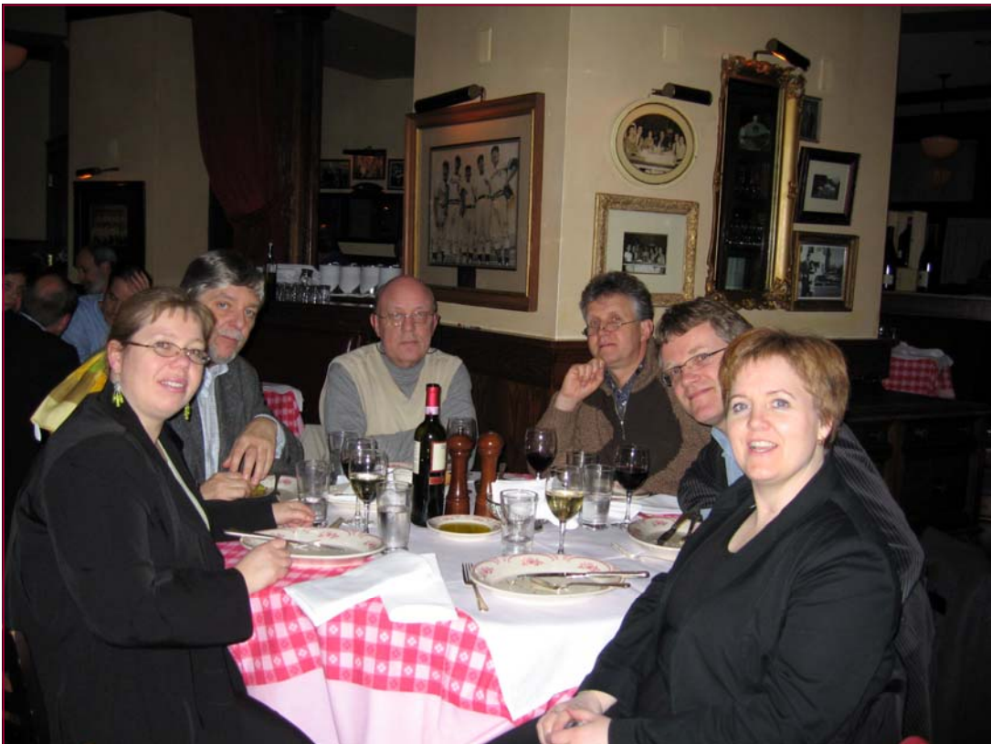
Notaleg kvöldstund að lokinni heimsókn í Boston Latin High School

Á fundinn voru mættir um 12 foreldrar og umræðan snerist að mestu um greiðslur á reikningum sem stjórnandi tónlistarstarfsins lagði fram. Foreldrafélagið veltir miklum fjárhæðum og styrkir starfið mjög mikið. Það hefur því mikil afskipti af rekstri tónlistardeildar skólans. Engir foreldrar voru mættir frá öðrum listgreinum þrátt fyrir að félagið sé einnig hugsað fyrir þann hluta skólastarfsins. Stjórnandi tónlistarstarfsins fær ekki greiðslur fyrir að vinna með foreldrafélaginu en telur það engu að síður mjög nauðsynlegt. Umræðan snerist einnig um skreytingar fyrir stóra tónleika sem verið var að skipuleggja. Foreldrar sjá um slíkt, ásamt því að vinna við að taka á móti tónleikagestum og hafa eftirlit á tónleikum. Forvitnilegt var fyrir okkur að kynnast þessu öflugra foreldrafélagi í Boston Latin High School og fyrir hve miklum fjármunum því var treyst. Einnig hversu mjög foreldrar voru virkir með beinu vinnuframlagi sem er nær óþekkt í starfi reykvísku skólahljómsveitanna.