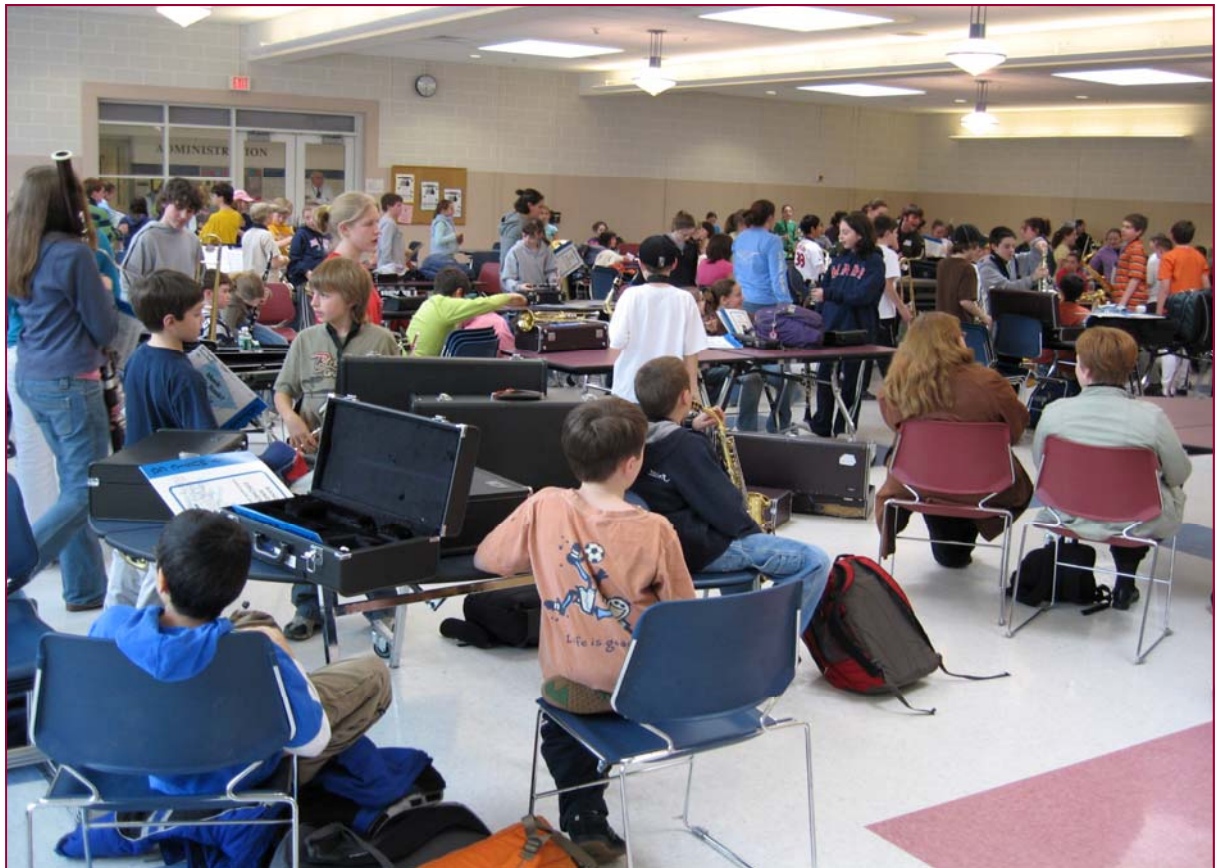
Nemendur í King Philip (unglingastig) á æfingu. Verið er að tilkynna hverjir þeirra fá að leika einleik á tónleikum.