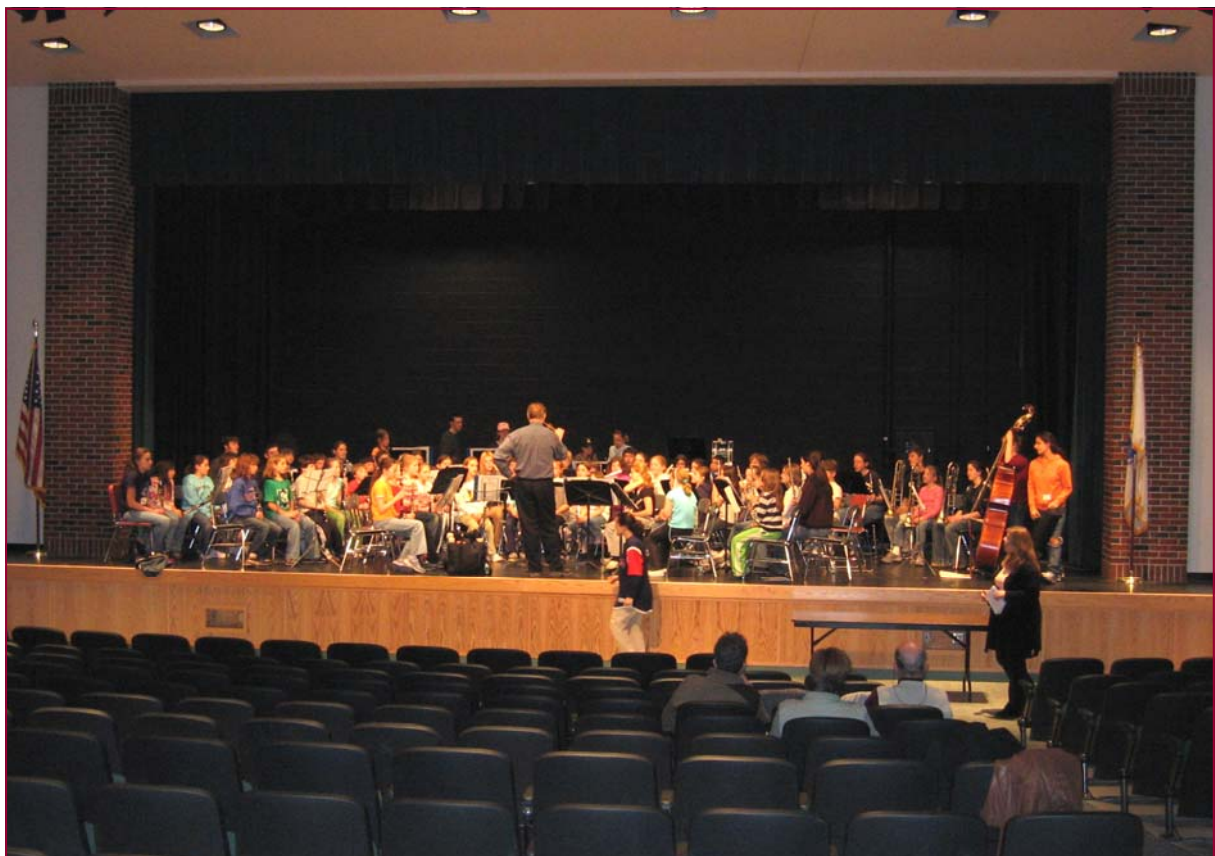
Hljómsveitaræfing hjá Honor Band í hátíðarsal King Philip High School