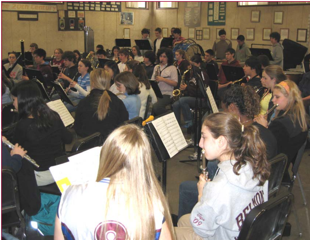
Áhugasamir nemendur í Belmont High School á hljómsveitaræfingu.