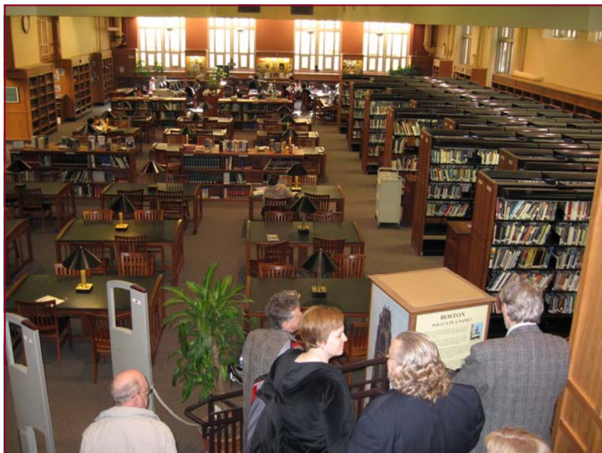
Bókasafnið í Boston Latin High School var sérlega glæsilegt.

Í skólanum er stór og glæsilegur salur með sviði þar sem tónleikar og aðrir viðburðir fara fram. Nemendur fara ekki mikið annað til að halda tónleika. Yfir veturinn eru 7 – 8 stórir viðburðir í skólanum. Mikið er um próf og nemendur þurfa að standa sig vel til að geta haldið áfram námi. Margir falla því úr skólanum eftir tvö ár.