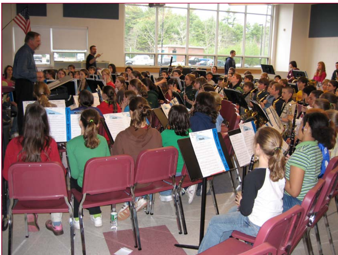
Hljómsveitaræfing í King Philip High School. Mikið mátti læra af kennsluaðferðum hljómsveitarstjórans og athygli vakti hversu nemendur voru agaðir.